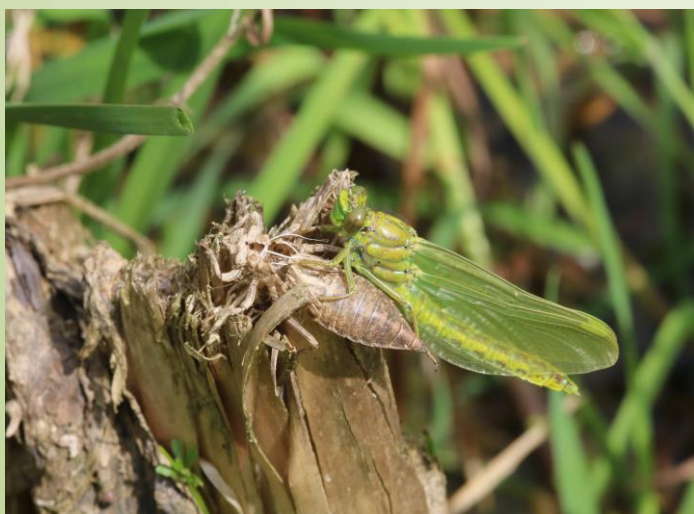
Emergence de Gomphe gentil (O. Duval)