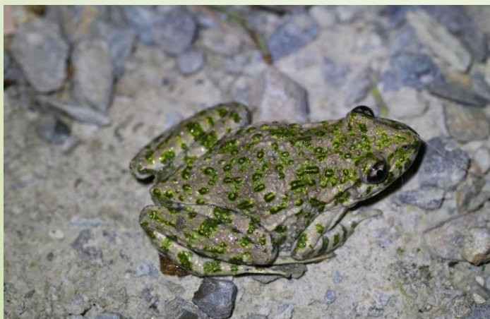
Pélodyte ponctué (O. Duval)

Le petit plan d'eau est connu pour les 21 espèces de libellules recensées et les 7 espèces d'amphibiens observés dont le Triton crêté, le Triton alpestre ou le Pélodyte ponctué (tous protégés par la loi). Le site fait l'objet d'un suivi de la biodiversité dans la cadre d'un réseau de mares restaurées ou créées. Le printemps est la belle saison pour rencontrer une petite faune aquatique exubérante.