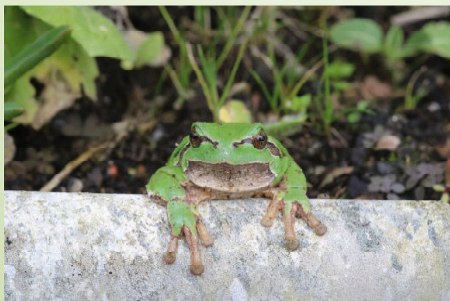
Rainette (O. Duval)