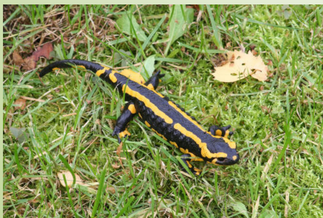
Salamandre (O. Duval)