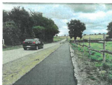
Voie douce, chêne repère au loin