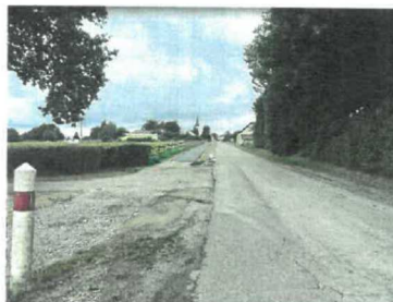
Voie douce, vue vers le clocher de l'église